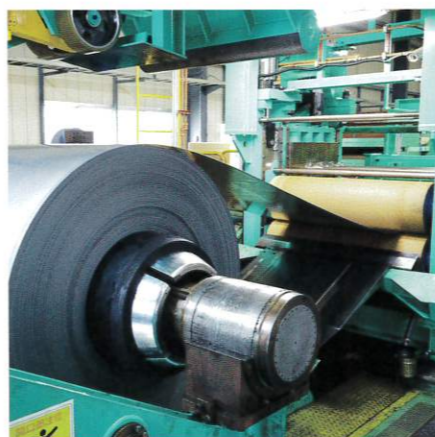
最大外径1200mmのコイルをスリットして、ワッシャーやボルトに

また、自動車メーカー各社が生産拠点を海外に移転させたことから、2006年にはタイに現地法人を設立。同一規格の製品を大量生産する業界の要請を受け、複数のコイルを溶接することで製品のロット増を実現できる、オシレート加工機を導入した。環境配慮を意図した技術開発にも余念がなく、通常はスクラップになる溶接箇所を減らし、材料ロスを縮小。のちにオシレート加工機は名古屋工場にも「逆輸入」され、鐘光産業に向けられる信頼はより盤石なものになった。