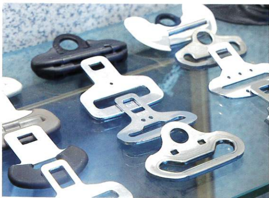
シートベルト、エンジンといった重要部品に用いられることが多い