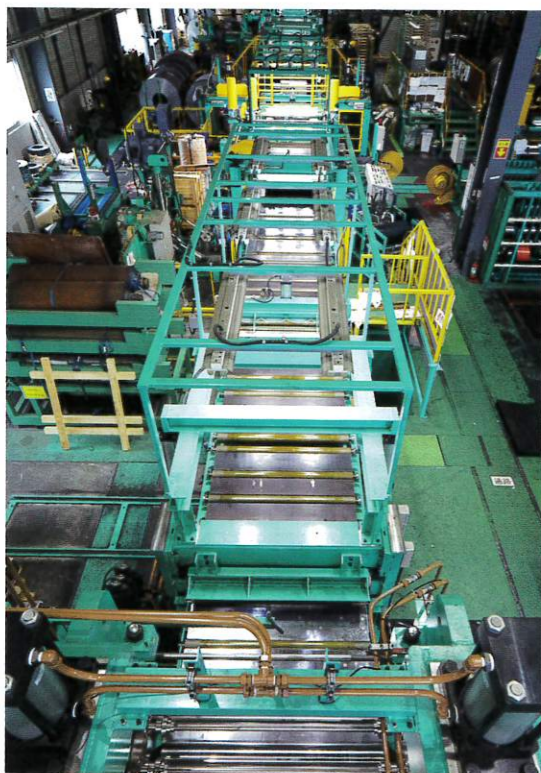
通常は毎分100mのところ、50~60mの速度でラインは進む

その後、特殊鋼は家電、自動車へと適用範囲を広げていく。川崎製鉄、新日本製鐵といった高炉メーカー各社も生産に本格参入。それまでは普通鋼しか生産していなかった高炉が特殊鋼も扱うようになり、鐘光産業も企業規模を拡大させていった。